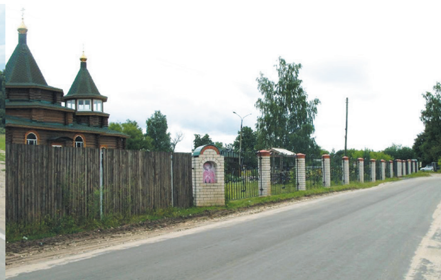
Орехово-Зуевский муниципальный район. Автодорога. Подъезд к д. Малая Дубна. Устройство асфальтобетонного покрытия. Работы завершены.