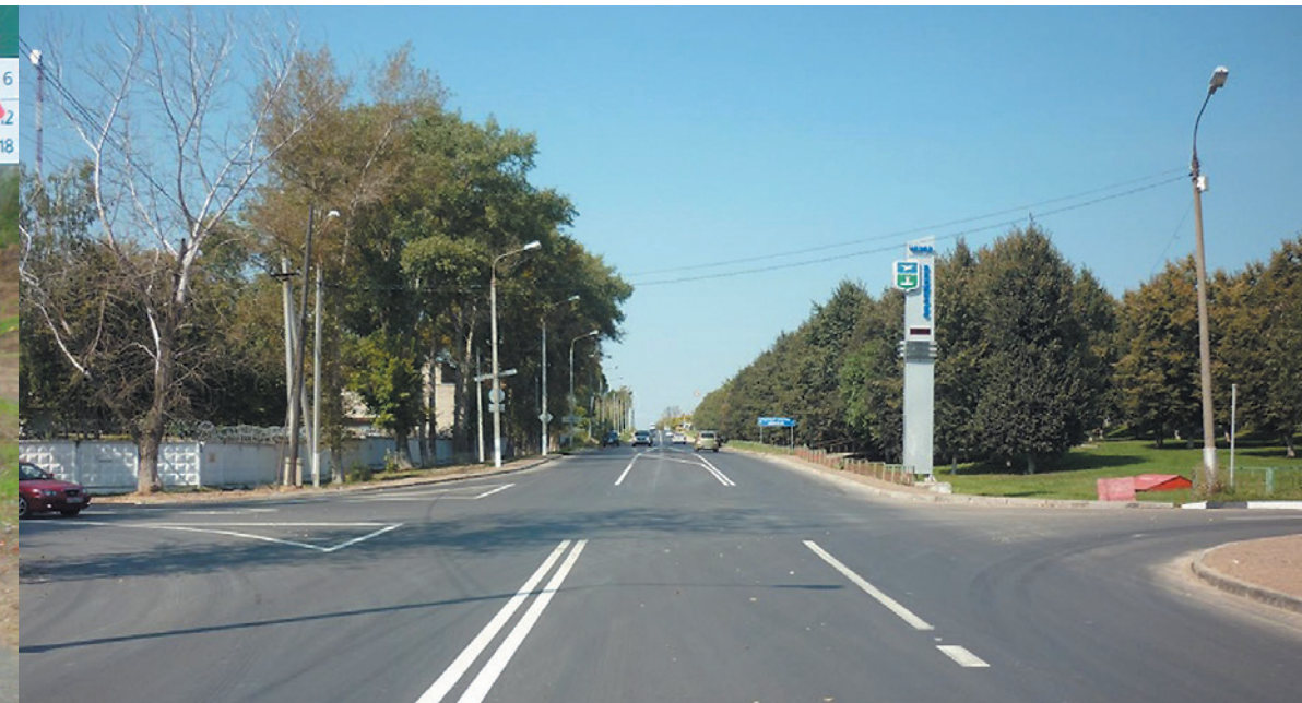
Чеховский муниципальный район. г. Чехов, ул. Гагарина, км 1+200 Нанесение горизонтальной разметки пластиком.