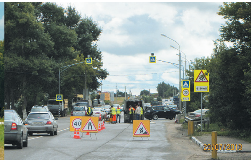
Городской округ Домодедово. Автодорога «Ям – Горки ленинские», км 0+230, с. Ям, ул. Центральная. Установка импульсной индикации и дорожных знаков.