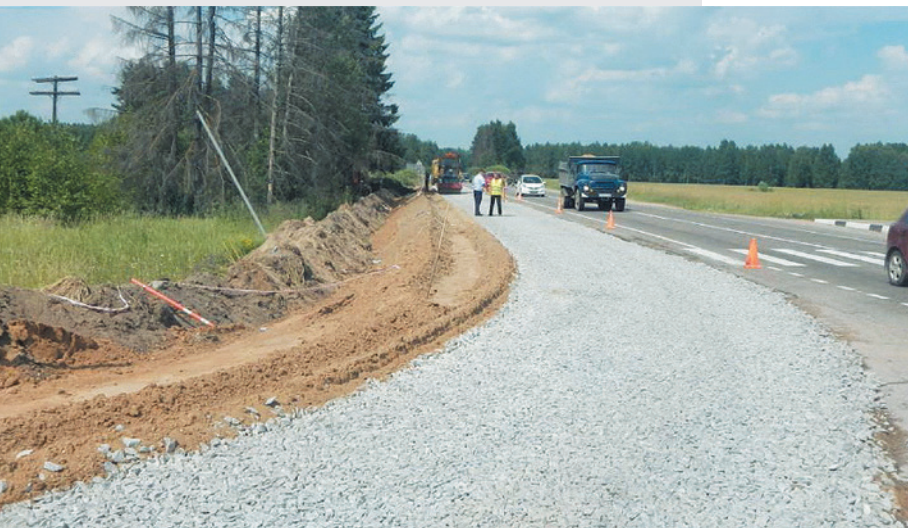
Талдомский муниципальный район. Автодорога «г. Дмитров – г. Талдом», км 28+650 Устройство щебеночного основания.