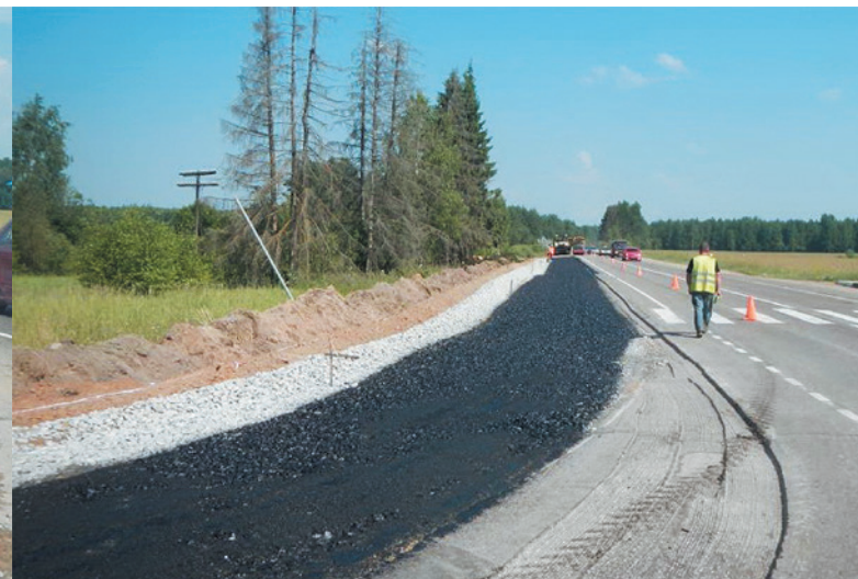
Талдомский муниципальный район. Автодорога «г. Дмитров – г. Талдом», км 28+650 Разлив битумной эмульсии.