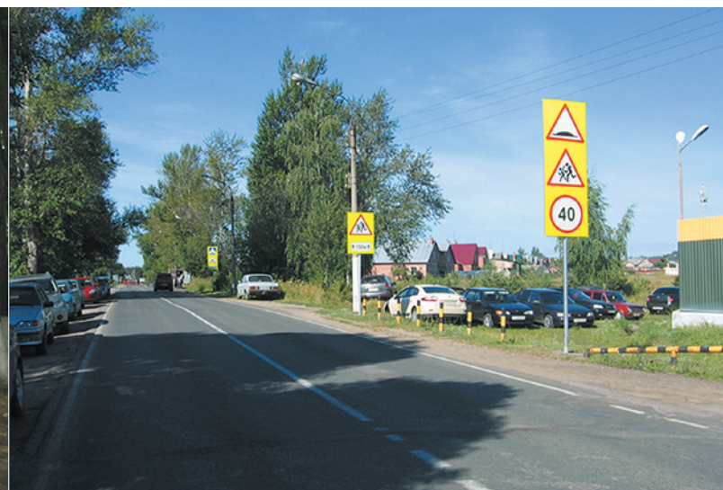
Ступинский муниципальный район. Автодорога «г. Ступино – Городище – Озеры», км 0+400 Установка дорожных знаков.