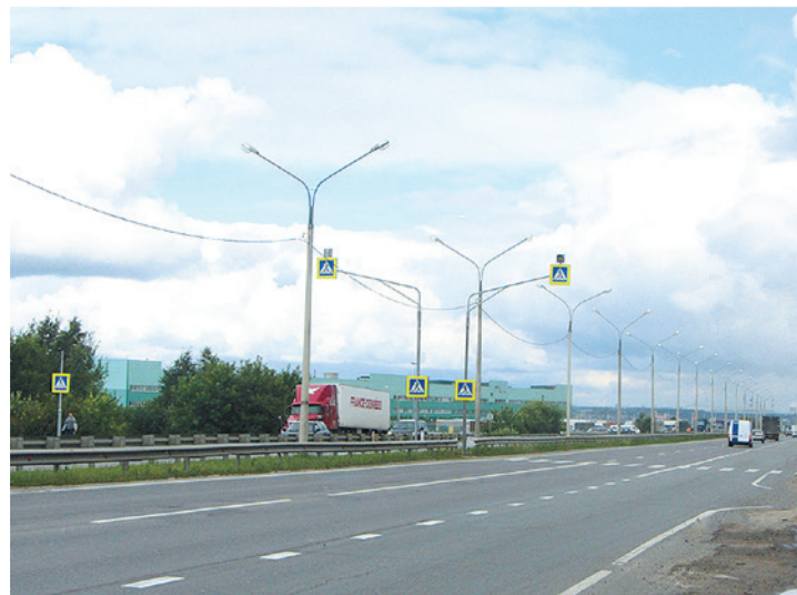
Городской округ Домодедово. Автодорога «Каширское шоссе», км 37+303 Установка импульсной индикации и дорожных знаков.