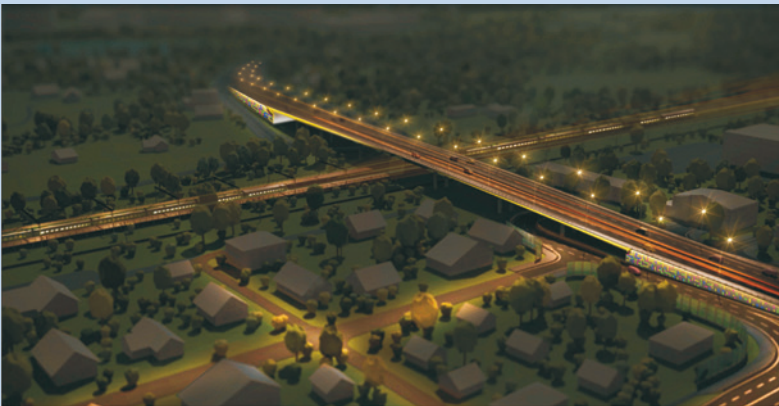
Архитектурное освещение. Вид путепровода (пл. Новодачная)