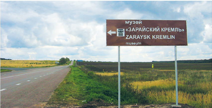
Каширский муниципальный район. Автодорога «г.Кашира – Серебряные Пруды – Узловая», км 32+160. Работы завершены.

План: 100 указателей Факт: 100 указателей