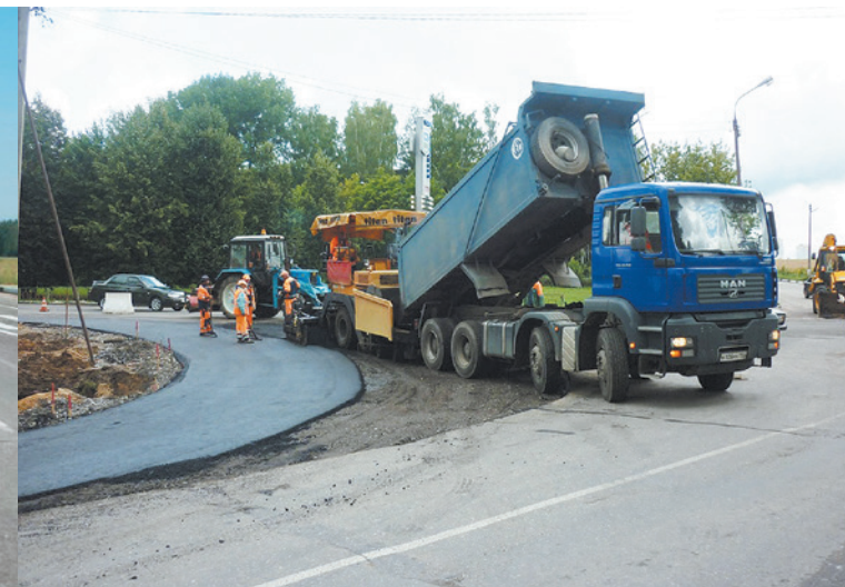
Чеховский муниципальный район. г. Чехов, ул. Гагарина, км 1+200 Устройство нижнего слоя покрытия из асфальто-бетонной смеси на уширение.