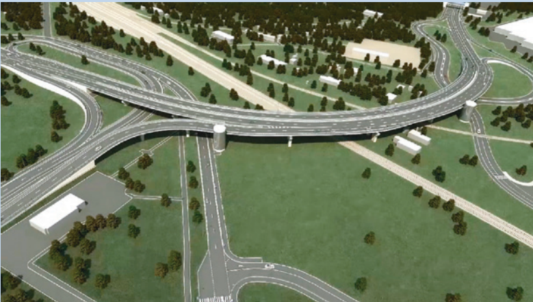
Проектное решение. Вид путепровода (Ступино).