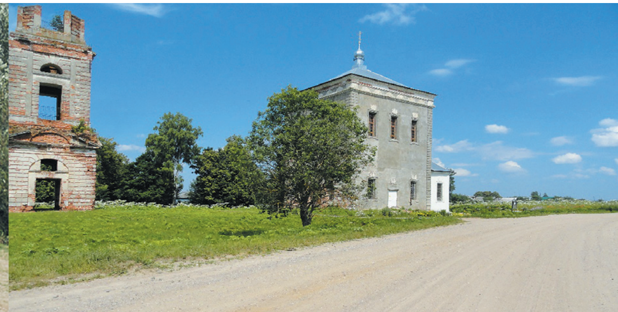
Сергиево-Посадский муниципальный район. Автодорога «Зимняк – Калошино – Федорцово» Храм д. Заболотье.