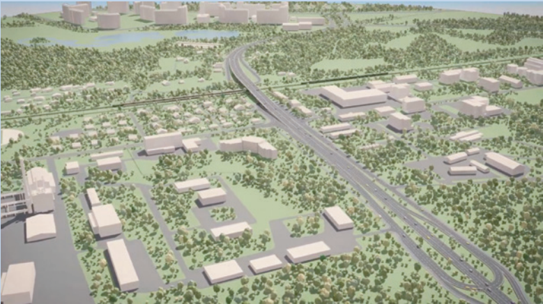
Проектное решение. Вид путепровода (пл. Новодачная).