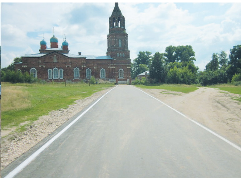
Орехово-Зуевский муниципальный район. Автодорога «Ликино-Дулёво – Шатурторф» – Гора – Сальково. Устройство асфальтобетонного покрытия. Работы завершены.