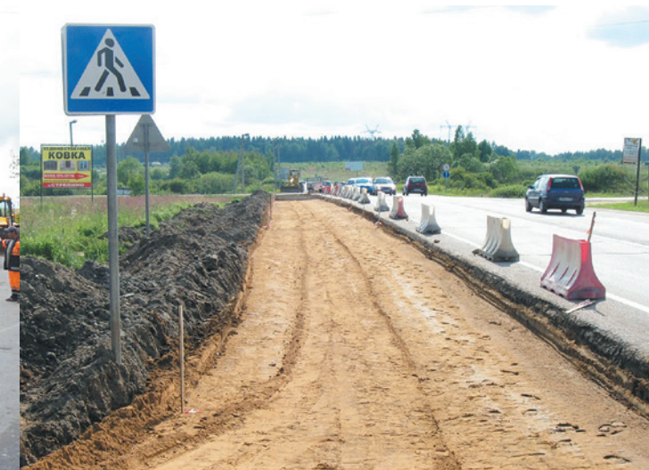
Солнечногорский муниципальный район. Автодорога «Пятницкое шоссе», км 3+500 Устройство песчаного подстилающего слоя.