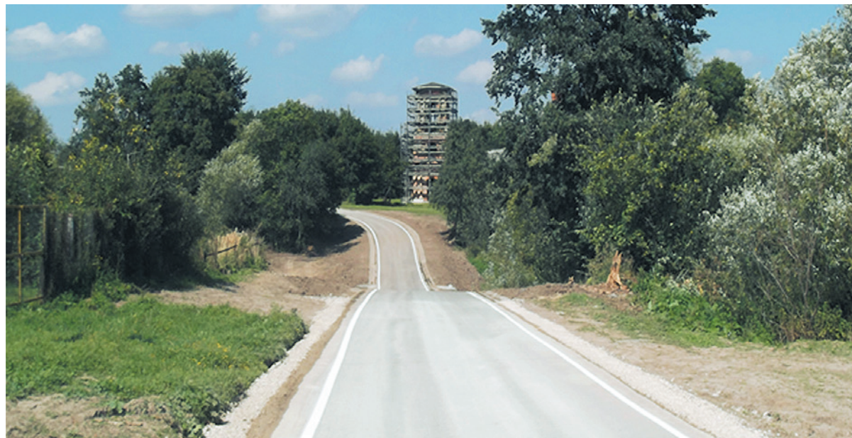
Зарайский муниципальный район. д. Моногарово, проезд по деревне №3 км 0+000-0+720 Устройство асфальтобетонного покрытия. Работы завершены.