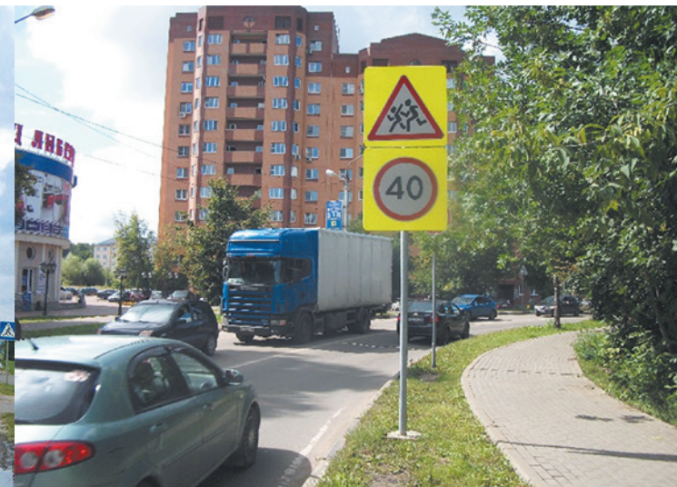
Дмитровский муниципальный район. г. Дедовск, ул. Гагарина, км 0+240 Установка дорожных знаков.