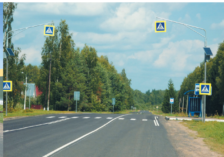
Шаховской муниципальный район. Автодорога «Шаховская – Волочаново», км 9, с. Муриково. Установка на консоли дорожных знаков со светодиодной индикацией.