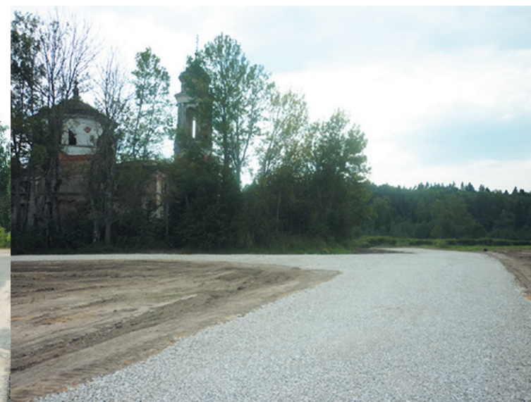
Клинский муниципальный район. Автодорога «Павельцево – Вертково – Нудоль» – Васильевское – Сай- моново км 0+850-5+522. Съезд к Знаменскому храму с. Теплое. Устройство съезда к храму. Работы завершены.