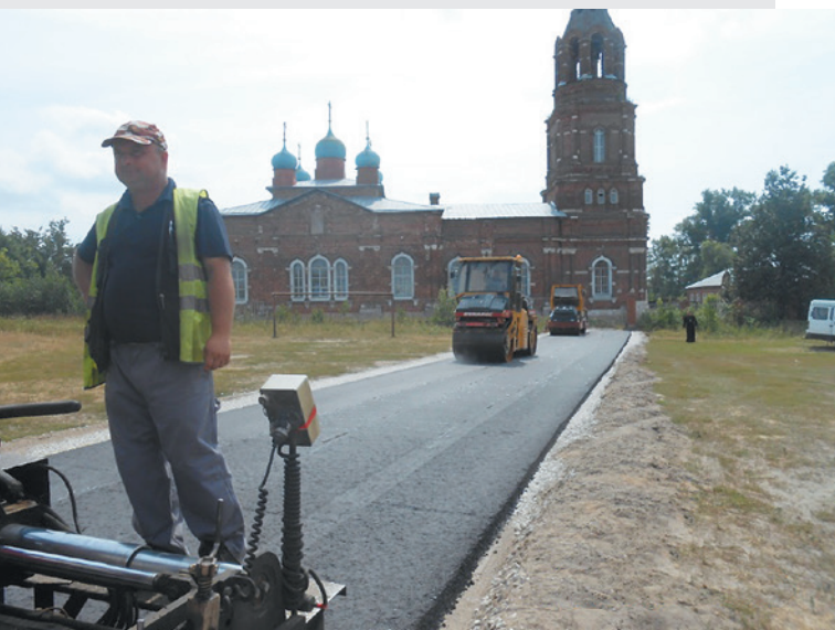
Орехово-Зуевский муниципальный район. Автодорога «Ликино-Дулёво – Шатурторф» – Гора – Сальково. Устройство асфальтобетонного покрытия.