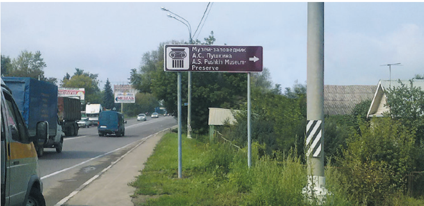
Каширский муниципальный район. Автодорога «Можайское шоссе», км 43+960. Работы завершены.