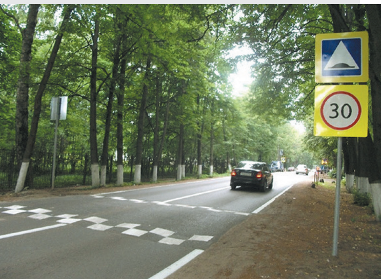
Красногорский муниципальный район. Автодорога «Ильинское ш. – Архангельское – Захарково», км 1+256 п. Архангельское. Установка дорожных знаков.