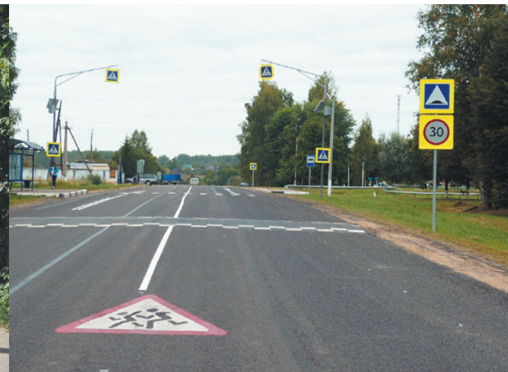
Шаховской муниципальный район. Автодорога «Шаховская – Волочаново», км 9+000 Нанесение дорожной разметки.