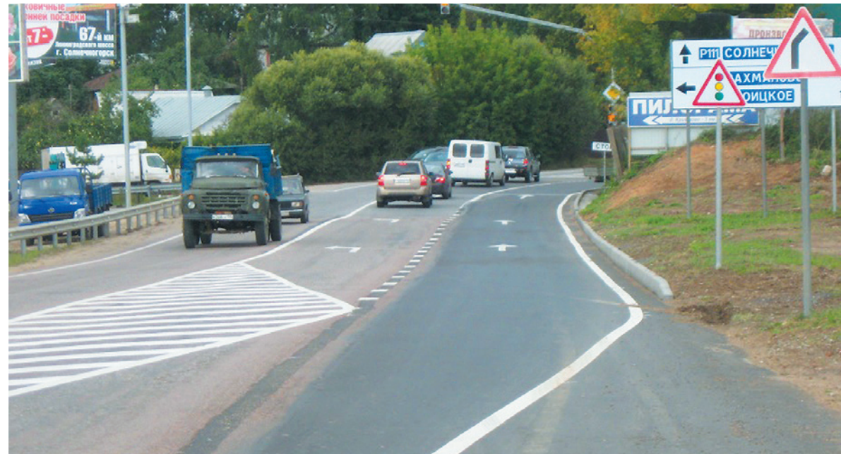
Солнечногорский муниципальный район. Автодорога «Пятницкое шоссе», км 6+400 Нанесение дорожной разметки.