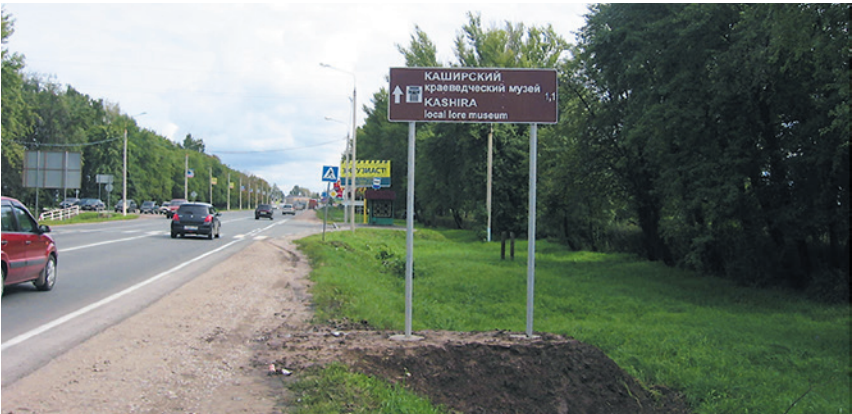
Каширский муниципальный район. Автодорога «г.Кашира – Ненашево», км 116+220. Работы завершены.